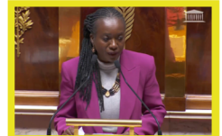
Discours sur la loi d'urgence pour Mayotte