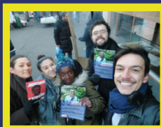
Aulnay-sous-Bois Tournée des commerçants