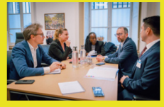
Échange avec l'office de secours de l'ONU en Palestine