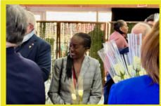
Vœux des séniors de la Ville de Bondy