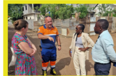
Déplacement de soutien à Mayotte