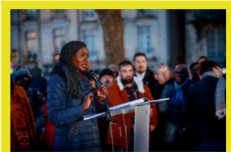
Commémoration à Nantes de la Ire abolition de l'esclavage