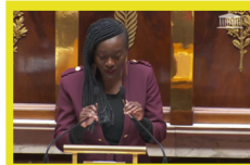
Motion de censure du gouvernement Bayrou