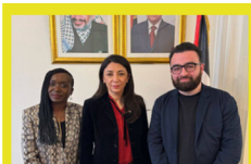
Avec l'ambassadrice de Palestine en France