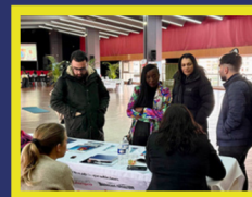
Bondy Forum sur la santé