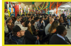
Cérémonie des vœux à Bondy