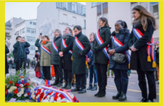
Hommage aux victimes de Charlie Hebdo