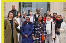
Échange avec des lycéens d'Aulnay-sous-Bois