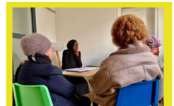
Rendez-vous en permanence