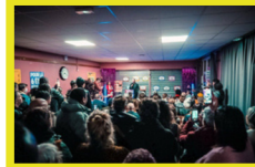
Cérémonie des vœux à Aulnay-sous-bois