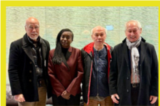
Échange avec des Bondynois rapatriés d'Indochine