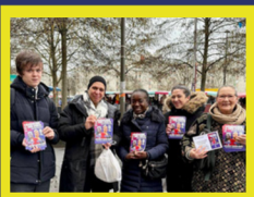
Aulnay-sous-Bois Sur le marché