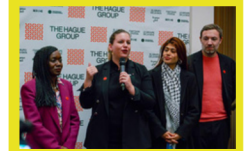
Rencontre internationale de soutien à la Palestine à La Haye