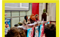
Meeting contre l'extrême droite à Besançon