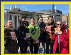
Les Pavillons-sous-Bois Sur le marché