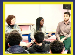
Aulnay-sous-Bois Rencontre avec des collégiens