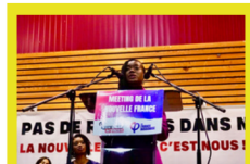
Meeting pour le lancement du réseau antiraciste insoumis