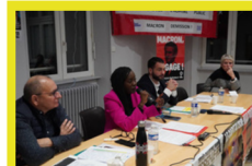
Réunion publique sur la santé à Audincourt