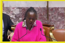
Vote du repas CROUS à 1€ pour tous les étudiants