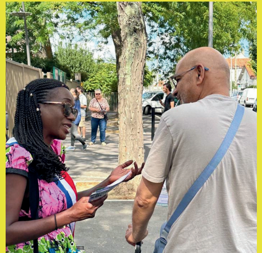
À Aulnay-sous-Bois en soutien au mouvement pour un Plan d'Urgence en Seine-Saint-Denis

▶ L'ensemble des services publics sont plongés dans la difficulté. ◀