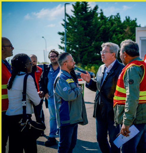
Avec Jean-Luc Mélenchon, en soutien aux salariés de l'entreprise MA France à Aulnay-sous-Bois

À nouveau, nous manquons d'enseignants, d'accompagnants d'élèves en situation de handicap (AESH), ou de postes en médecine scolaire. Depuis des mois avec les militants de la France insoumise, je me bats pour un plan d'urgence dans l'éducation , aux côtés de la communauté éducative d'Aulnay, de Bondy et des Pavillons. Le maire d'Aulnay se réveille pour critiquer Parcoursup quand de notre côté nous demandons son abrogation pure et simple depuis des lustres. Je redépose ma proposition loi pour donner un statut aux AESH , afin de rendre ce métier attractif au service des élèves et des parents épuisés. La droite, les macronistes et le RN, s'ils la rejettent à l'Assemblée, devront rendre des comptes pour nos villes !